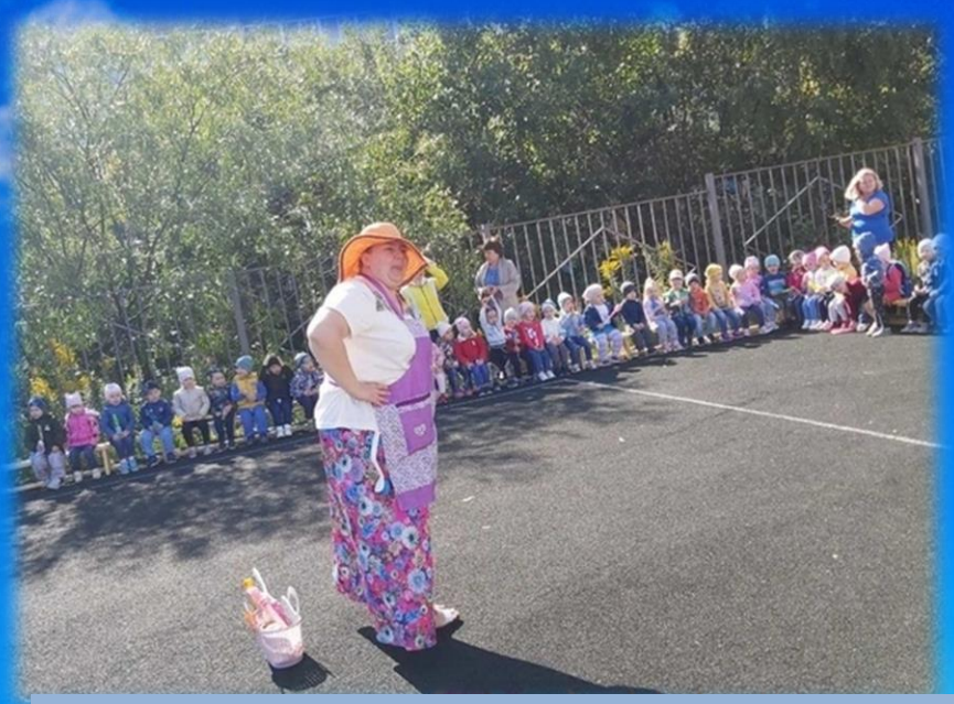
Наши гости: Хозяюшка и фея пузырей.