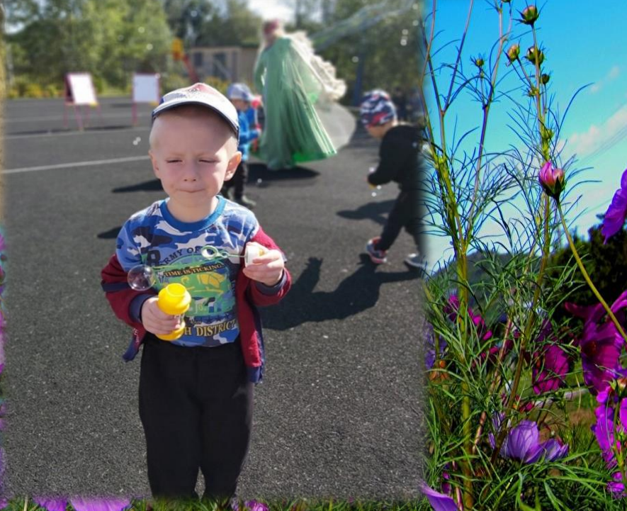
Игры и развлечения: «Рисуем мыльными пузырями», «У кого большой пузырь?»