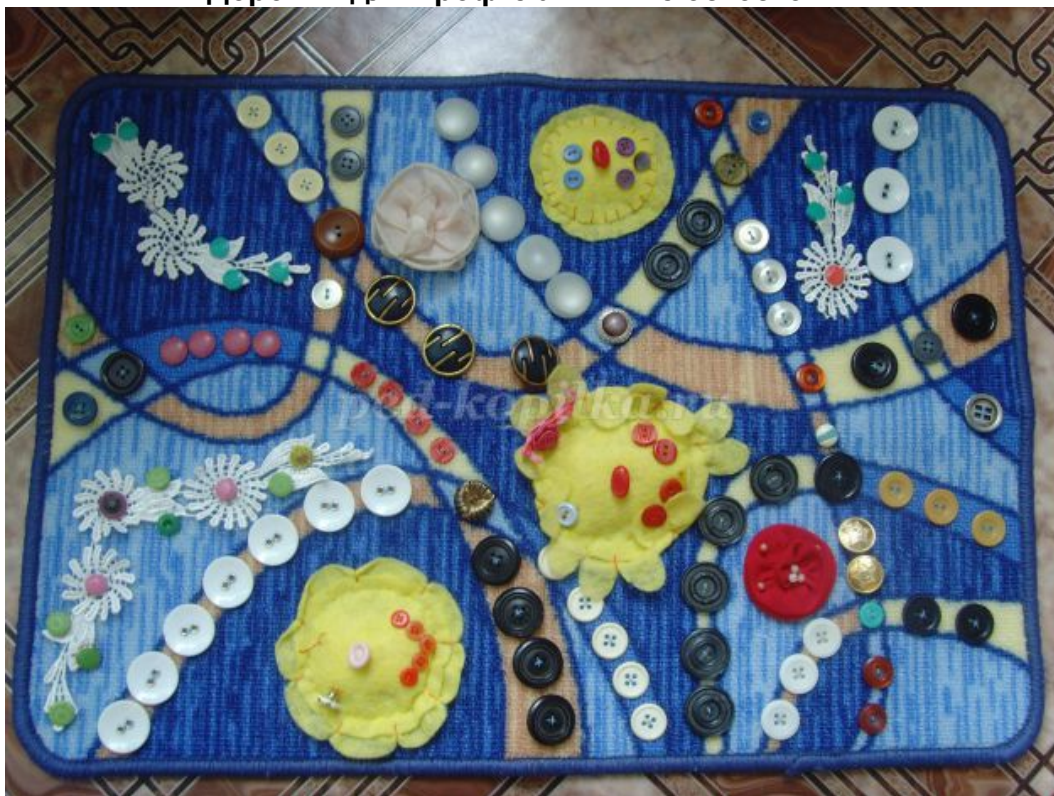
«Дорожки для профилактики плоскостопия»