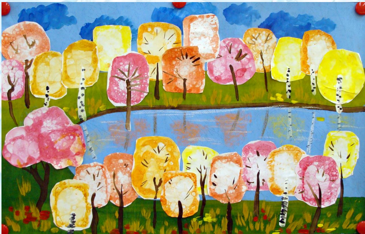
Коллективная работа подготовительной группы «Речецветик»