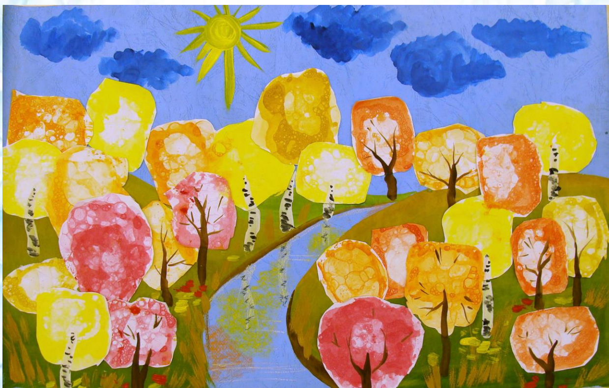
Коллективная работа старшей группы «Юнга»