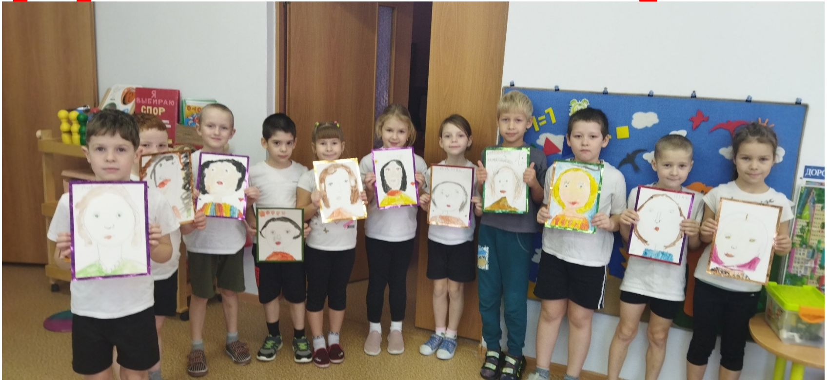
Группа «Логовичок» 2021г